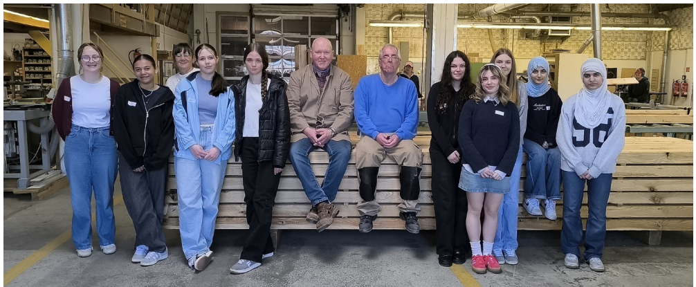
Ein Besuch in der Tischlerei gehört zum Zukunftstag dazu.

fe-Werkstätten hautnah kennenlernen. Mit dem informativen Imagefilm der Lebenshilfe begann der Tag für die interessierten Schülerinnen, die sich beim Rundgang durch die Werkstätten und der handwerklichen Betätigungen einen ganz persönlichen Eindruck von der Zusammenarbeit von Menschen mit und ohne Beeinträchtigung machen konn-