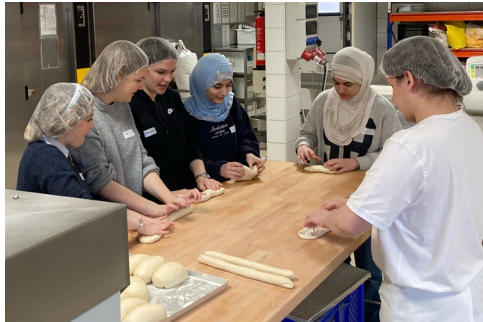
Hoch motiviert gingen die Teilnehmer des Zukunftstages an den Backtisch.

Ein Hefezopf backen in der Backstube des Brötchengebers, in der Tischlerei einen Oster-Anhänger aus Holz erstellen und im Drahtesel einen Fahrradreifen wechseln: Beim Zukunftstag in der Lebenshilfe konnten neun Mädchen im April die ganz unterschiedlichen Tätigkeiten in den Lebenshil-