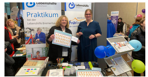
Viele Interessierte besuchten unseren Stand

Fragen zum Freiwilligen Sozialen Jahr, zu den beruflichen Möglichkeiten zum Beispiel für Heilerziehungspfleger:innen in der Tagesstätte und der Frühförderung oder als Erzieher:in in unserem „Kindergarten für alle“: Die Mitarbeiter:innen der Lebenshilfe waren gefragte Ansprechpartner:innen während der Berufsmesse „pimb – Pädagogik-Informationsmesse Bremerhaven“. Die Fachmesse für pädagogische Berufe im Timeport II gab Schüler:innen und interessierten Fachkräfte